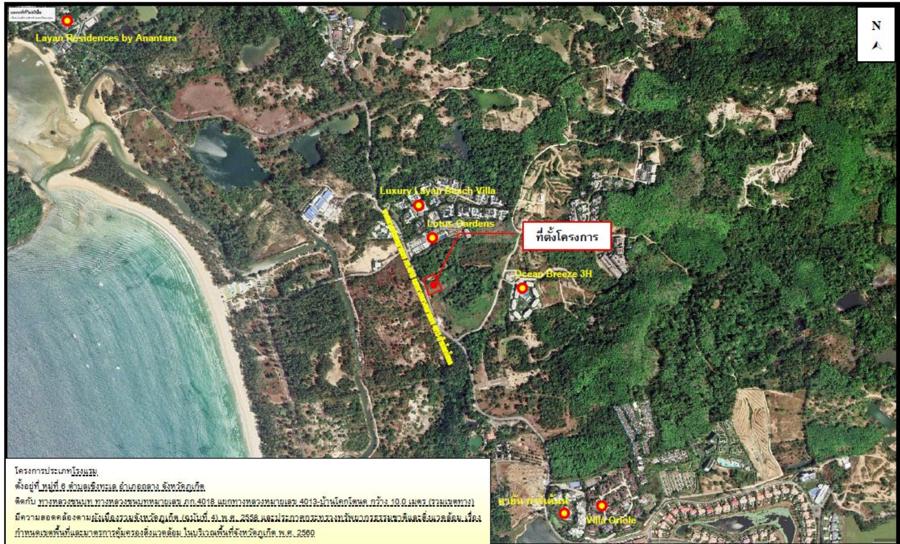
รูปที่ 1.6-1 แผนที่ตั้งโครงการโดยสังเขป